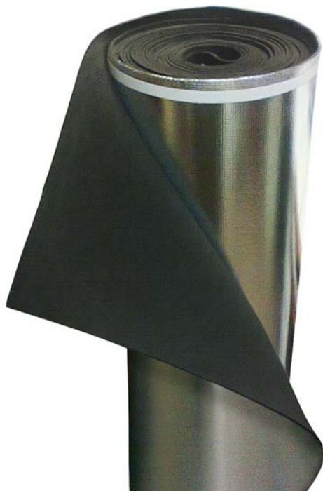
Lámina True Silence LAM3-4900