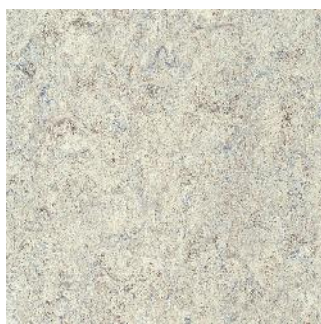
Smoked Pearl 125-155