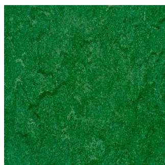
Avocado Green 125-041