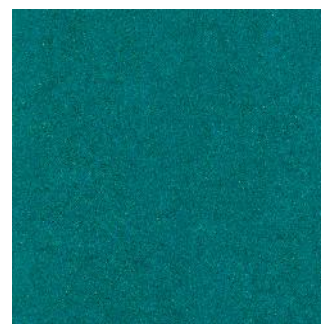
Curacao Petrol 125-129