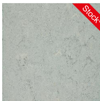
Ash Grey DLWL-0011