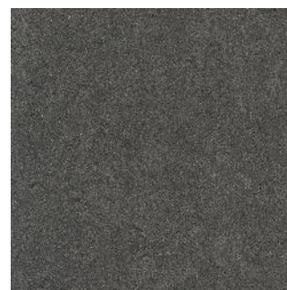
Industrial Grey 125-160