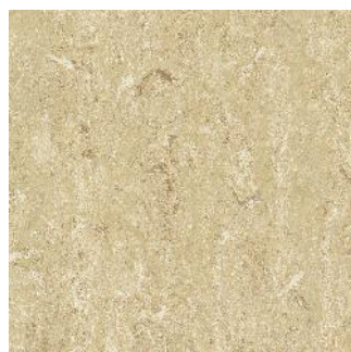
Beeswax Beige 125-146