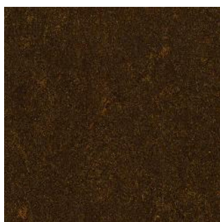
Mokka Brown 125-108