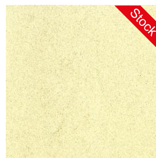
Banana White DLWL-0010