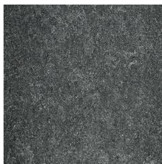
Plumb Grey 125-059