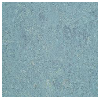
Dusty Blue 125-023

(*) Productos indicados, contamos con stock en reposición permanente, los otros colores en modalidad a pedido.