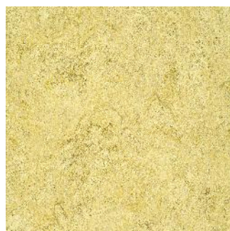
Rocky Brown 125-070